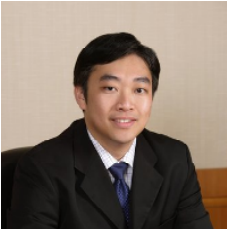
King Fuei Lee

L'objectif du fonds est d'obtenir un rendement total avec un faible niveau de volatilité. Il investit dans des sociétés asiatiques qui offrent des rendements attrayants et des paiements durables de dividendes ainsi que de bonnes perspectives de croissance du capital. Depuis la crise financière asiatique il y a dix ans, les sociétés de la région assainissent leur bilan et se concentrent sur la maximisation des profits. Cette tendance a posé les bases de paiements durables de dividendes, la région étant reconnue comme génératrice de rendements.