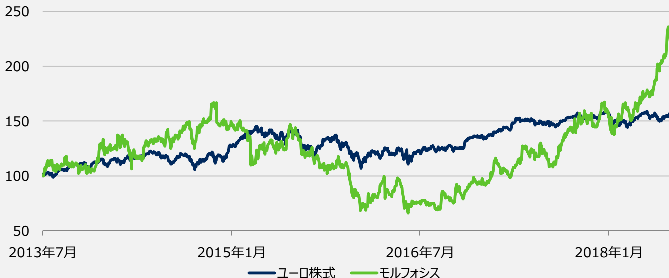
□ 直近5年間の株価推移